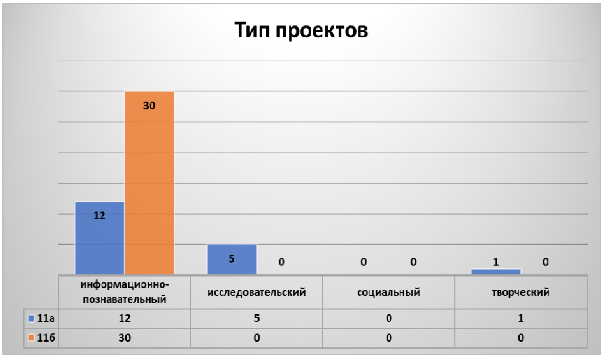
Рисунок 1. Тип проектов